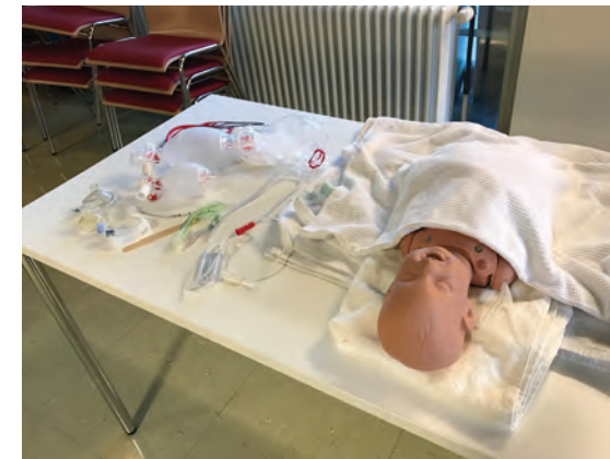
EPALS - praktische Übungen für den Ernstfall

Beispiele für die praktischen Übungen sind das Freimachen und Freihalten der Atemwege, die Möglichkeiten eines Gefäßzugangs beim Kind sowie die pädiatrischen Besonderheiten bei Volumenersatz, Pharmakotherapie und Defibrillation. In Kleingruppen werden ausgesuchte Themen diskutiert und auch ethische As-